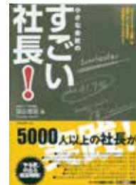
フォレスト出版 羽山 直臣著 定価/¥1470

この本は、お客作りの80%を占める「営業対策関連」の16事例を紹介している。営業対策関連に絞ったのには理由がある。一般的に中小企業は、どこにでもある商品を扱っている場合が多く、強い商品や競争力のある商品を手に入れるには費用がかかり時間もかかる。これに対して、営業対策関連は仕組み作りの問題であり、費用がかからずに早く業績を良くすることができるからだ。事例の後、あなたの会社でも応用できるように「〇〇社長の7つの戦略ポイント」として解説を加えた。ただ正直に言えば、私は16事例について公表してよいものか迷った。なぜなら、本気に経営をよくしたいと考えている人にとっては、これらは垂涎の事例であり、その取り組みを応用できるように分析してしまった本だからである。この本を読み終わった時、あなたは、あなたの仕事に応用できる経営のヒントをいくつも見出すであろう。その共通項こそ業績をよくするルールであり、あなたは業績を良くする実行の入り口に立つことになる。