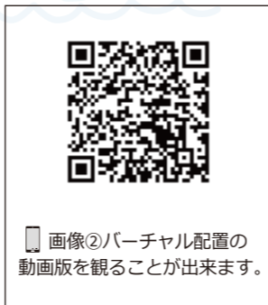
画像②バーチャル配置の動画版を観ることが出来ます。

店舗を経営されている皆様もご興味がある方はぜひ弊社までご相談ください。理想の空間をプロデュース致します。(A)