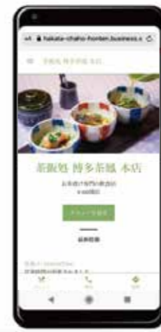
博多茶鳳様の Google ウェブサイト (スマホ画面) 「博多茶鳳」で検索

* * * * ホームページを“無料”で作成できるサービス * Googleマイビジネスのウェブサイトビルダー