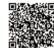
Google マイビジネス ウェブサイトビルダー

自社サイト制作のように、外注制作費・運営保守メン テナンス料に出来るだけ費用を掛けたくない方、開業間 もなく時間に余裕がない方、デジタルが苦手なサイト運 営に自信がない方、ウェブでの集客が疑心暗鬼で「お試し」 でHPを作ってみたい方などは、ぜひお試しください。