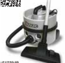
乾式掃除機 ニューバック NVH-180 ¥24,970(税込)