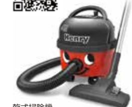
乾式掃除機 ヘンリーコンパクト HVR160-11 ¥49,500(税込)