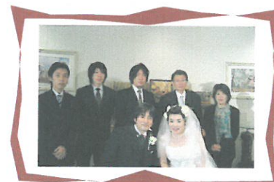
新郎新婦を囲んで...