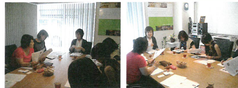
*張さんの軽妙かつ深いお話しに聞き入ってしまいました

初めてやってみて、私も勉強になりました。なにしろ、お店はオープンしてからが始まりですもんね。これからも、この会は続けていこうと思っマス。 次回はどなたにしようか・・・楽しみながらお役に立てれば、続くかなあ～・・・乞うご期待 (M)