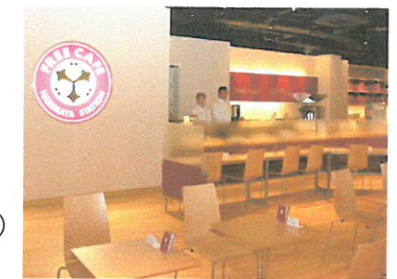
播磨屋ステーション福岡 福岡市博多区店屋町1-35 三井ビル2号館1F 営業時間は10時~19時。年末年始のみ休業。

播磨屋の無料に対するこだわりはホームページからも体験できます。 無料お試しセットなるものを注文すると十数種類のおかしが無料(送料160円のみ)で送られてきます。