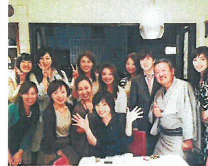
男性の方! カッコよくエスコートして欲しいです。

せっかく出向いたレストランで嫌な思いをしないために。あやふやな記憶の作法を明確にするために。年末にかけての忘年会やクリスマスディナーで、あたふたしないように。是非、ご参加を!