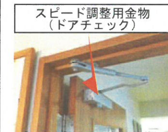
① ファーストスピード調整

扉の閉まるスピードが速くて「バタンッ」と閉まって「うるさいし、壊れないかな～」と思っている方は是非お試し下さい。扉の上に金物がついているモノならスピード調整が可能です。しかも簡単に女性でもできちゃいます。下の写真の①⇒②⇒③の順番でドライバで左右に回すとスピード調整が出来、ちょうど良い感じで扉を調整できます。右に回せばゆっくりと閉まり、左に回せばスピードが速くなります。調整は3段階あり(2段階のモノもあります)③をゆっくりと閉まる様に調整するのがポイントです。ご興味のある方は一度やってみると面白いかもしれません。金物がついていない扉も今から取付が可能です。※場合によっては付かないタイプの扉もあります。(A)