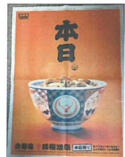
2006年9月の日本経済新聞の全面広告