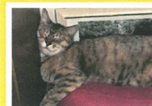
「ムーさん、寝違えるヨ!」 「いいの! 私はこのスタイルが好きなんだから...」