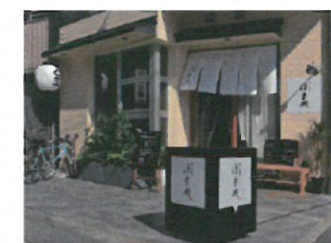
夜間は手前のボックス照明、左上の提灯が灯っています。是非ご来店ください。

はま岡さんの看板メニューは「慶州鍋」。暑い季節こそ、是非“辛くて美味しい”鍋で乗り越えていきましょう!(フクダ・ウシダ)