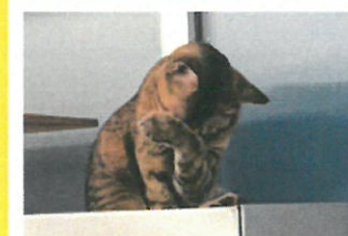
おやおはいつもきれいがもっとです。あいだのつとめです。<Reiji>