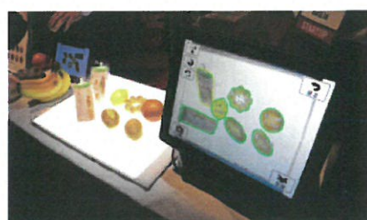
「BakeryScan (ベーカリースキャン)」は2013年からサービス開始。バーコードが使用できない商品を、独自のスキャナで認識し精算が可能。