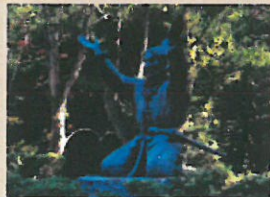
上/神話で有名な天照大神像が祀られています。右/伊勢に続き、快晴。拝殿の注連縄には迫力がありました。