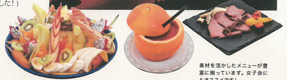
素材を活かしたメニューが豊富に揃っています。女子会にもオススメです!

●BAR Coin the Real 〒810-0041 福岡県福岡市中央区大名2丁目1-51 マウンテンファイブ 5-A(営) 19:00~2:00 不定休(年内無休) ☎070-2806-5246